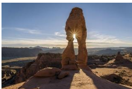
Het Corona gebed

God, toevlucht in onze nood, kracht in onze vertwijfeling en angst, vertroosting in ziekte en lijden. Wees ons, Uw volk, nabij en genadig nu wij allen de gevolgen ondervinden van het uitgebroken corona-virus. Wees een Beschermmer voor hen die dit virus hebben opgelopen, Wij bidden voor hen om hoop en genezing. Wij bidden voor hen die aan de gevolgen van dit virus zijn overleden, dat zij bij U geborgen mogen zijn. Wij bidden voor allen die werkzaam zijn in de gezondheidszorg en het openbaar bestuur, dat zij Uw nabijheid en zegen mogen ervaren in hun werk ten dienste van heel de samenleving. Doe ons beseffen hoe groot Uw liefde is voor ieder van ons en dat Gij met ons zijt nu wij de kwetsbaarheid van ons bestaan ervaren. Versterk ons geloof en onze hoop zodat wij ons altijd zonder aarzelen overgeven aan Uw vaderlijke voorzienigheid. Door Christus onze Heer. Amen.